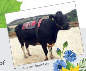
Kuh Mila am Reitplatz